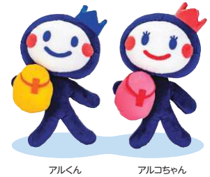
アルくん アルコちゃん

職場の仲間や家族の皆さんと参加できる1日型のイベントを今年も「春」「秋」「冬」に分けて開催します。詳細や各地区の日程はソニー健保ウェブサイトでご案内しています。